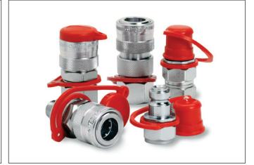
Hızlı Birleştirme Kaplinleri Quick Couplings