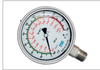
1000 Bar Ø100mm Manometre 1000 Bar Ø100mm Gauges