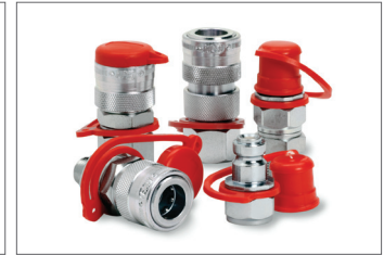
Hızlı Birleştirme Kaplinleri Quick Couplings