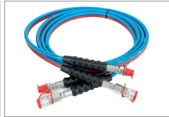
Hidrolik İkiz Hortumlar Hydraulic Twin Hoses