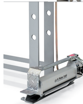
Abbildung mit Fußpumpe Picture with foot pump