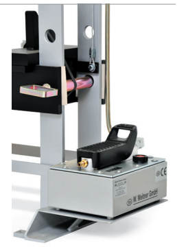
Abbildung mit Lufthydraulischer Pumpe Picture with air hydraulic pump